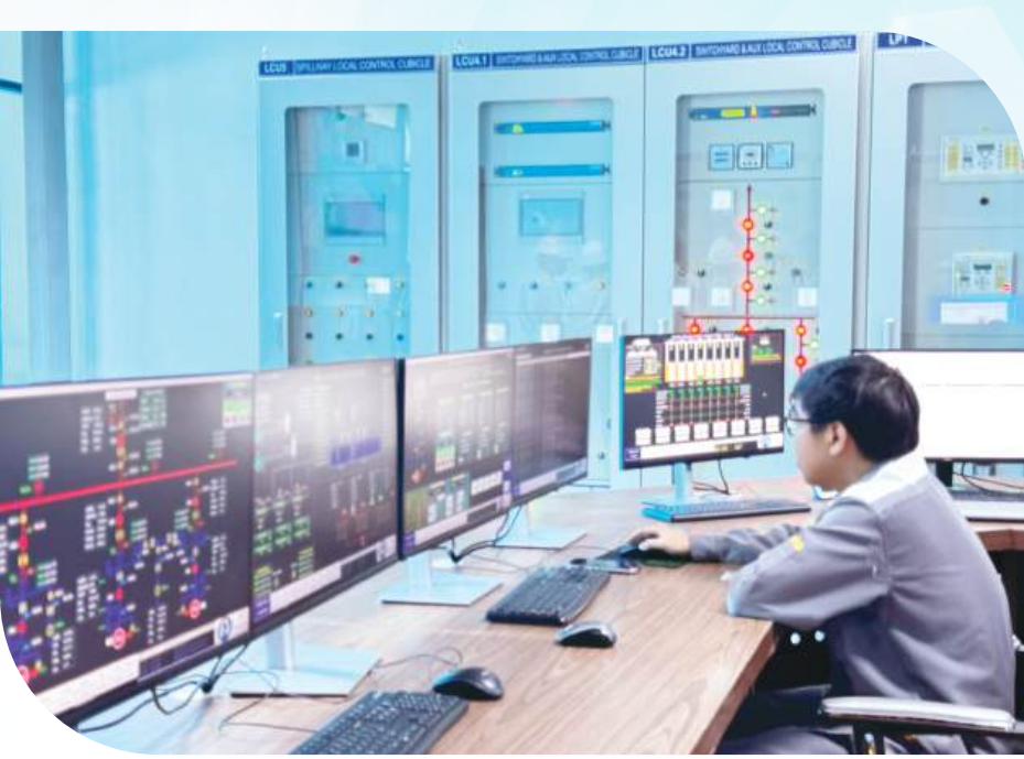
Hệ thống vận hành hoạt động tại Nhà máy Thủy điện Phú Tân 2 (xã Phú Vinh, tỉnh Đồng Nai).

3/2026 (tăng mạnh 30-40%). Trước áp lực “gọng kìm” từ chi phí vận tải và rủi ro đứt gãy chuỗi cung ứng, vai trò điều phối vĩ mô của Bộ Công Thương đã trở thành lá chắn quan trọng. Với tổng nguồn cung cả nước đạt 8,173 triệu m 3 /tấn, chúng ta đã tạo ra một vùng đệm an toàn so với mức tiêu thụ thực tế 7,05 triệu m 3 /tấn, giữ vững mức tồn kho chiến lược khoảng 1,5-1,6 triệu m 3 /tấn.