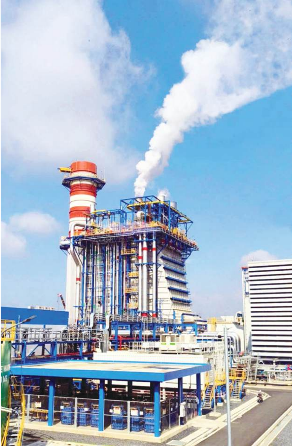
Dự án nhà máy Nhiệt điện tại Nhơn Trạch 3, 4 - nguồn cung quan trọng trong hệ thống năng lượng của tỉnh Đồng Nai.

đáp từ 60% - 70% nhu cầu tiêu thụ trong nước, giảm sự phụ thuộc vào nguồn cung ngoại khối.