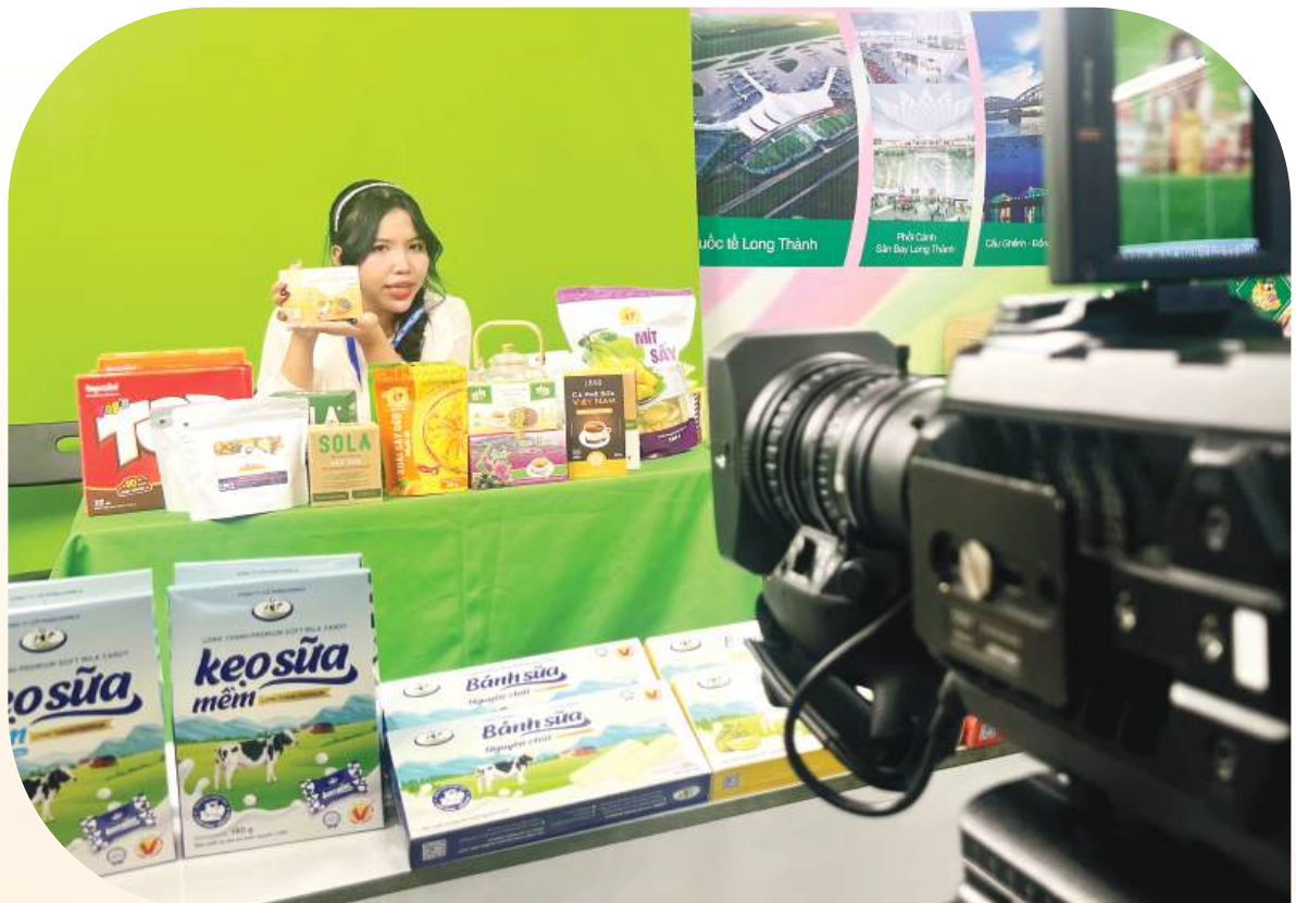
Phiên live stream bán hàng, quảng bá sản phẩm địa phương tại gian hàng của Đồng Nai tại hội chợ hàng Việt Nam tiêu biểu xuất khẩu năm 2025.

Với nền tảng xuất siêu vững chắc trong Quý I, cùng sự chủ động trong việc nhận diện và tháo gỡ các rào cản thực tiễn, ngành Công Thương Đồng Nai tự tin sẽ hoàn thành các chỉ tiêu kinh tế - xã hội giai đoạn 2026-2030, khẳng định vị thế đầu tàu kinh tế của tỉnh và cả nước. ■