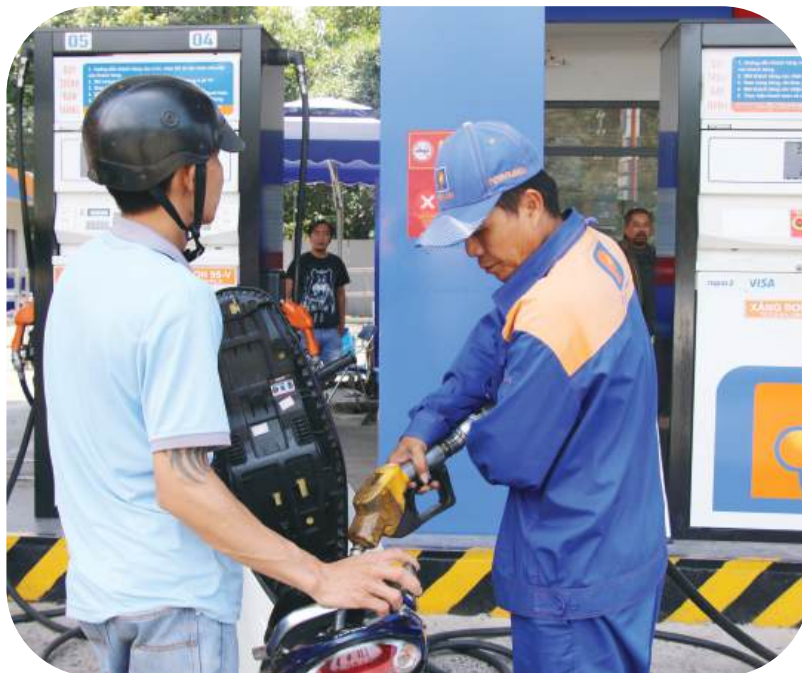
Người dân đến đổ xăng tại một cửa hàng bán lẻ xăng dầu tại xã An Viễn, tỉnh Đồng Nai.

Có hiệu lực thi hành ngay từ ngày ký (27/03/2026), Nghị quyết giao Bộ Công Thương đóng vai trò “nhạc