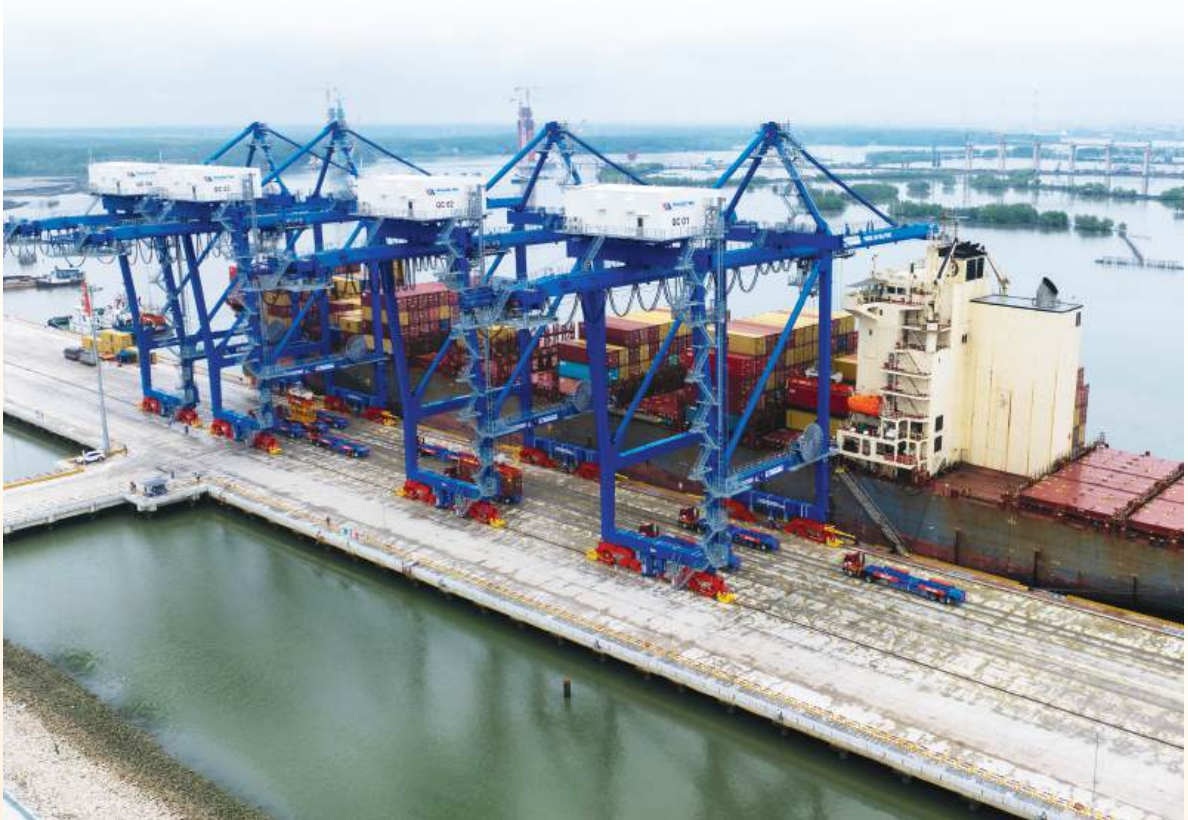
Hoạt động dịch vụ cảng tại cảng Phước An (xã Phước An, tỉnh Đồng Nai).

Tại phân khúc cụm công nghiệp (CCN), toàn tỉnh có 63 CCN được quy hoạch (3.701,96 ha). Đáng chú ý, 12 CCN đã đi vào hoạt động với sự góp mặt của 11 chủ đầu tư hạ tầng uy tín tại các khu vực trọng điểm như Tân Tiến, Tân Phú, Tiến Hưng, Thanh Phú - Thiện Tân... Tỷ lệ lấp đầy tại các cụm này đang ở mức rất cao, đáp ứng mặt bằng sản xuất cho 239 dự án đăng ký đầu tư.