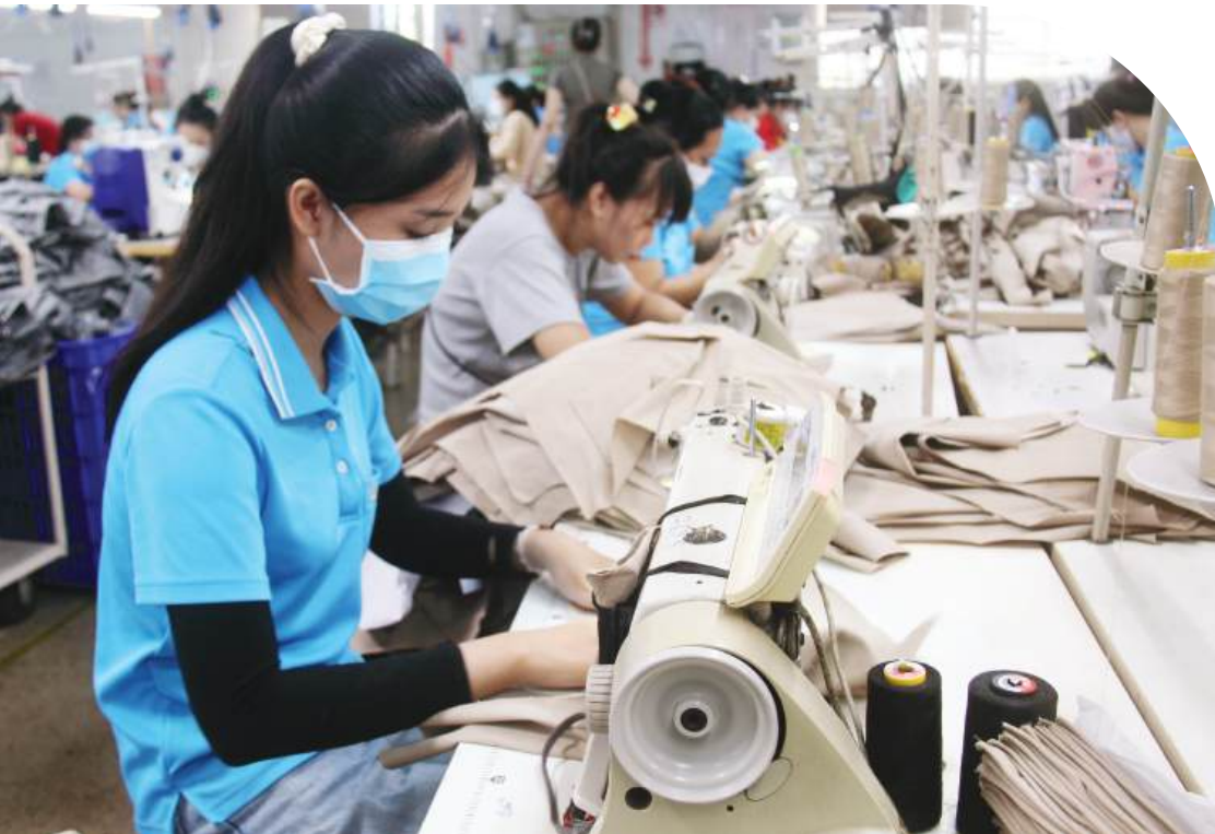
Hoạt động sản xuất tại một doanh nghiệp dệt may ở Cụm công nghiệp Phú Cường (xã Thống Nhất, tỉnh Đồng Nai) - Việc bình ổn giá xăng dầu góp phần giảm bớt áp lực chi phí đầu vào, giúp doanh nghiệp ổn định sản xuất trong năm 2026.

Sở Công Thương Đồng Nai cam kết thực hiện quyết liệt vai trò giám sát, phối hợp chặt chẽ với các cơ quan Trung ương để chính sách bình ổn giá lan tỏa thực chất đến mọi hoạt động kinh tế - xã hội, giữ vững vị thế là động lực tăng trưởng quan trọng của cả nước. ■