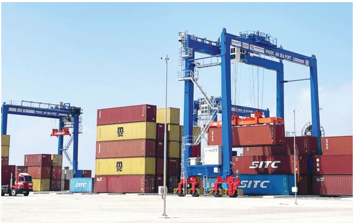
Hoạt động bốc dỡ hàng hóa tại cảng Phước An.

Trên nền tảng hội nhập sâu rộng, ngành Công Thương tỉnh Đồng Nai khẳng định cam kết tiếp tục đồng hành, giúp cộng đồng doanh nghiệp tận dụng tối đa “đòn bẩy” từ các FTA để bứt phá mạnh mẽ trong năm bản lề 2026. ■