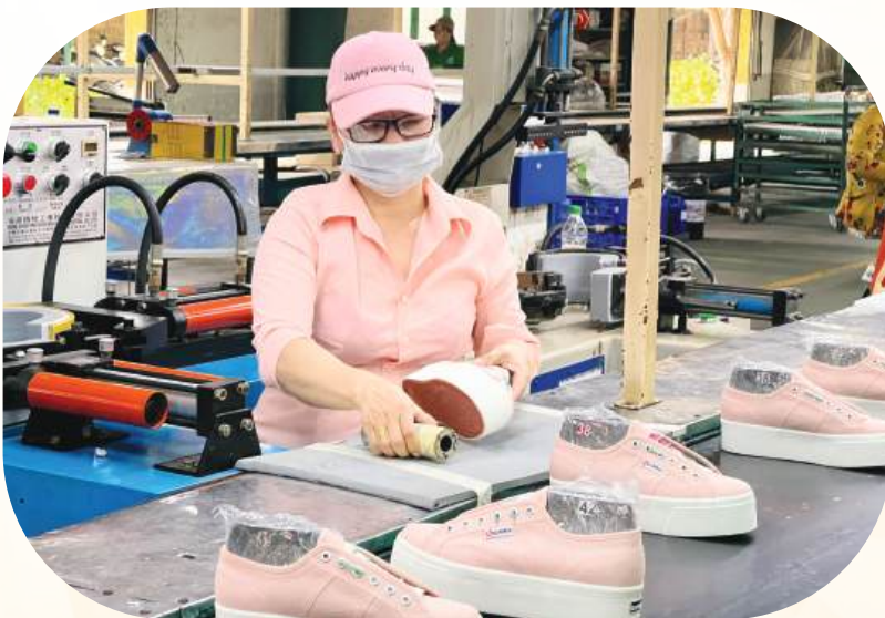
Sản xuất giày tại một doanh nghiệp ở xã Nhơn Trạch.

Với phương châm điều hành “6 rõ”, ngành Công Thương cam kết đồng hành sát sao cùng doanh nghiệp, biến PVTM từ thách thức thành cơ hội để khẳng định bản lĩnh của hàng Việt trong dòng chảy hội nhập. ■