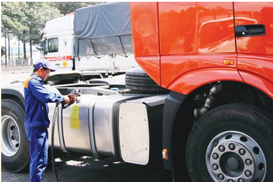
Hoạt động kinh doanh xăng dầu tại một cửa hàng bán lẻ xăng dầu ở xã An Viễn.

- Gia tăng nội lực cung ứng: Thực hiện Chỉ thị 06/CT-BCT, năng lực sản xuất nội địa được đẩy lên mức tối đa. Các cơ sở Ethanol, Condensat được đưa vào vận hành khẩn cấp để bù