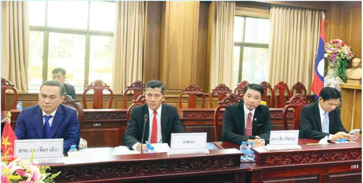
Đại diện Lãnh đạo tỉnh và Sở Công Thương tỉnh Đồng Nai tham gia thảo luận các giải pháp hợp tác, hỗ trợ doanh nghiệp địa phương tận dụng các ưu đãi thuế quan trong khối ASEAN để mở rộng thị trường xuất khẩu năm 2026 tại tỉnh Champasak (Lào).