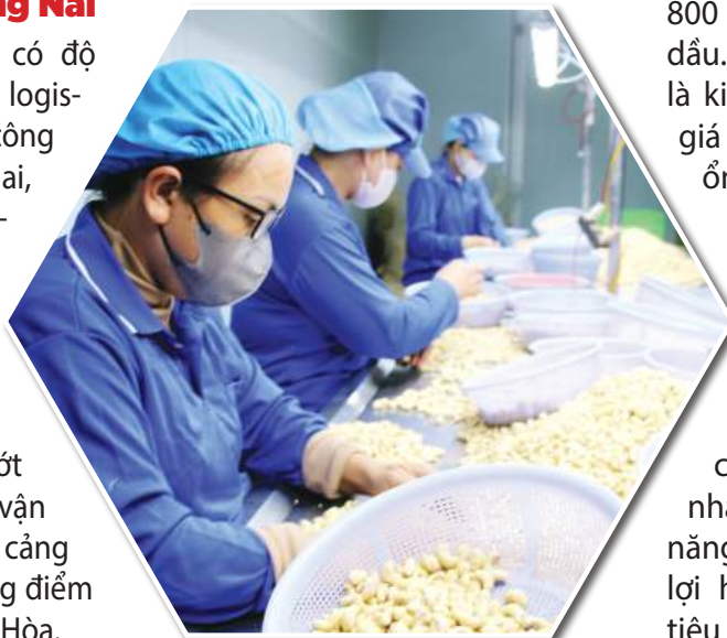
Sản xuất sản phẩm hạt điều tại một doanh nghiệp ở xã Xuân Hòa.

Chính sách đặc biệt này có hiệu lực ngắn hạn đến