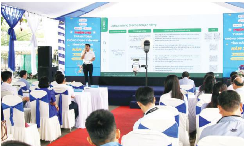
Các doanh nghiệp địa phương tham gia phiên chợ thanh toán không dùng tiền mặt tỉnh Đồng Nai và live stream quảng bá, bán hàng trực tuyến năm 2025 do Sở Công Thương tổ chức.

Sự kết hợp giữa kết quả thực tiễn “Top 10 cả nước trong 9 năm liên tiếp” của Đồng Nai và khung pháp lý mới từ Bộ Công Thương đang tạo ra một lực đẩy cộng hưởng. TMĐT không còn chỉ là kênh bán hàng mà đã trở thành hệ sinh thái tích hợp giữa công nghệ, thanh toán không tiền mặt và logistics xanh. Đối với một “thủ phủ công nghiệp” như Đồng Nai, đây là cơ hội vàng để bứt phá và nâng cao giá trị chuỗi cung ứng trong kỷ nguyên số. ■